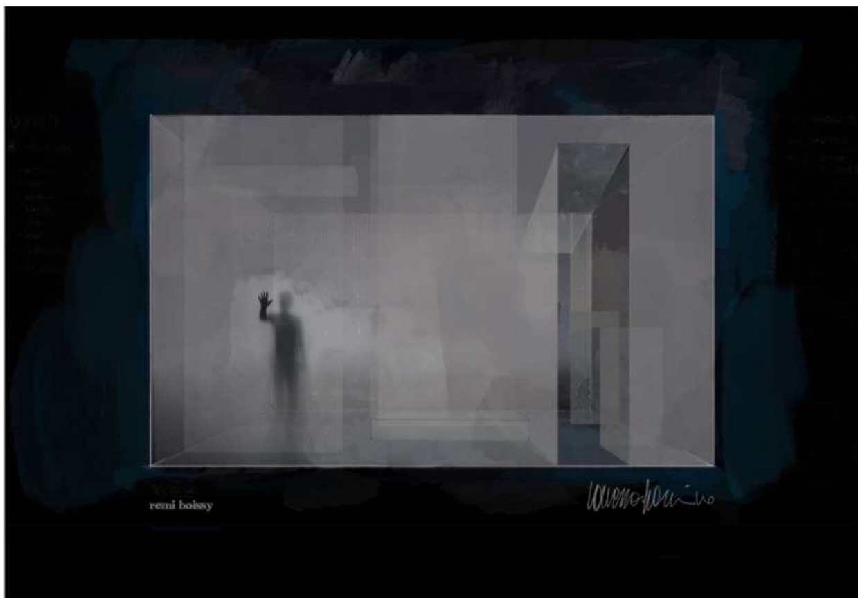
Projet scénographie © Vanessa Sannino

De ceux qui transforment l'instant en un inoubliable moment.